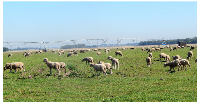
Fig.1. Alta lotação de ovinos em pastagens cultivadas em irrigação por pivô. O solo apresenta áreas irregulares que, com o funcionamento do pivô, tornam-se alagadiças.

gião interdigital e/ou no casco. Macroscopicamente, foram observados dígitos com lesões caracterizadas por crescimento exacerbado e irregular do estojo córneo dos cascos (Fig.4); hiperemia e alopecia da comissura interdigital com integridade da pele (Fig.5); proliferação irregular de tecido de granulação interdigital e necrose (Fig.6); perda da integridade da pele interdigital com lesões profundas e necrose da região axial, que se estende desde a face palmar/plantar até a face dorsal, com acometimento da banda coronária (Fig.7); acentuada necrose interdigital com perda tecidual da falange distal e deformidades dos dígitos com posterior desprendimento dos cascos e odor pútrido (Fig.8); abscesso (Fig.9); descolamento dos cascos na região axial e abaxial sem lesão prévia da pele interdigital (Fig.10); úlcera da banda coronária da região lateral com possível progressão para descolamento da face abaxial do casco (Fig.11); cicatrização, alopecia, tumefação e defor-