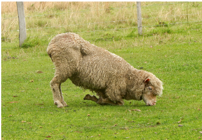
Fig.3. Ovino apoiado sobre as articulações cárpicas, na tentativa de se alimentar sem o contato dos cascos com o solo em detrimento a dor intensa.

mação da porção distal dos membros e/ou ausência dos dígitos (Fig.12) e hiperplasia da pele e subcutâneo interdigital (Fig.13).