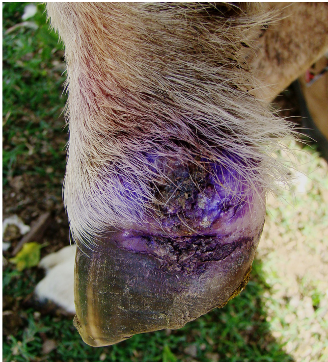
Fig.11. Região distal do membro torácico de ovino. Nota-se na face lateral do membro úlcera da banda coronária e descolamento leve da região abaxial do casco.