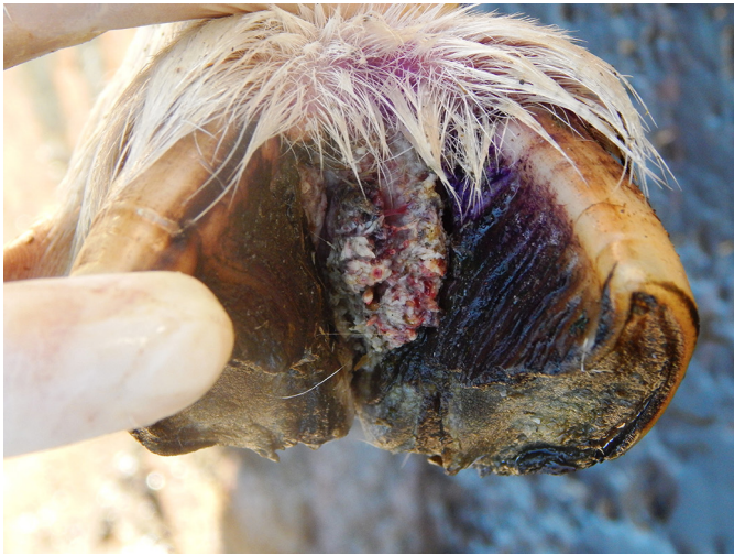
Fig.6. Proliferação irregular de tecido de granulação e dermatite no espaço interdigital de ovino.