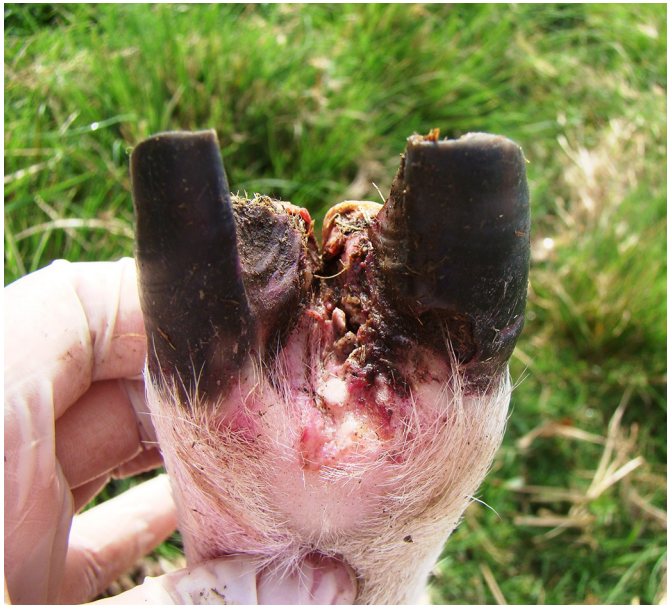
Fig.7. Membro pélvico de ovino com alopecia, hiperemia e necrose da pele interdigital com acometimento da banda coronária do casco.

prejuízos diretos tanto pela perda de peso dos animais como pelo déficit reprodutivo conforme observado em ovinos de algumas propriedades rurais aqui avaliadas. Essas perdas estão relacionadas à alta morbidade decorrente das lesões podais, acompanhada de perda de peso, diminuição no índice reprodutivo, desvalorização da lã, atraso de crescimento, miásas secundárias e ainda pelos gastos com produtos veterinários para o tratamento sintomático dos doentes (Rodrigues et al. 2001, Cavalcanti et al. 2004, Ribeiro 2007, Aguiar et al. 2011, Gargano et al. 2013, Smith et al. 2014, Witcomb et al. 2014).