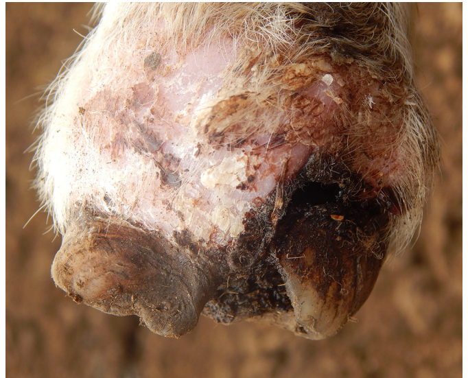
Fig.12. Região distal do membro pélvico de ovino com lesão crônica caracterizada por perda da arquitetura das lâminas do casco, dermatite crostosa e tumefação do membro.