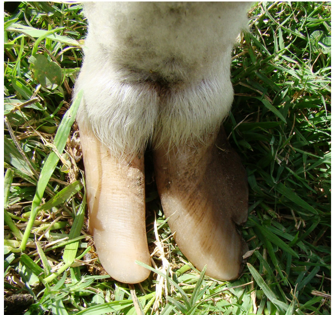
Fig.4. Casco com crescimento exacerbado e irregular da ceratina dura da pinça e da face abaxial do casco do membro pélvico de ovino.

Segundo os criadores, a maioria dos ovinos com lesões leves, quando tratados, se recuperavam, porém os ovinos que apresentavam deformidades nos dígitos e permaneciam na propriedade apresentavam atraso no desenvolvimento corporal, com perda de peso, que variava entre 5 e 20 kg, quando comparado com animais saudáveis da mesma faixa etária. Esses ovinos, com frequência, apresentavam