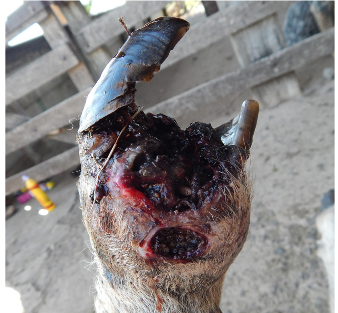
Fig.8. Região distal do membro torácico de ovino. Observa-se lesão severa com necrose que se estende até a região de falange proximal e miíase. Nota-se acentuada deformidade do membro e dos cascos.

de entrada para as bactérias. Sabe-se que as condições ambientais de umidade durante o período chuvoso e lesões traumáticas nos cascos favorecem a desvitalização do espaço interdigital dos ovinos e acúmulo de matéria orgânica, tornando-o susceptível à infecção por agentes causadores de dermatites podais, bem como úlcera de