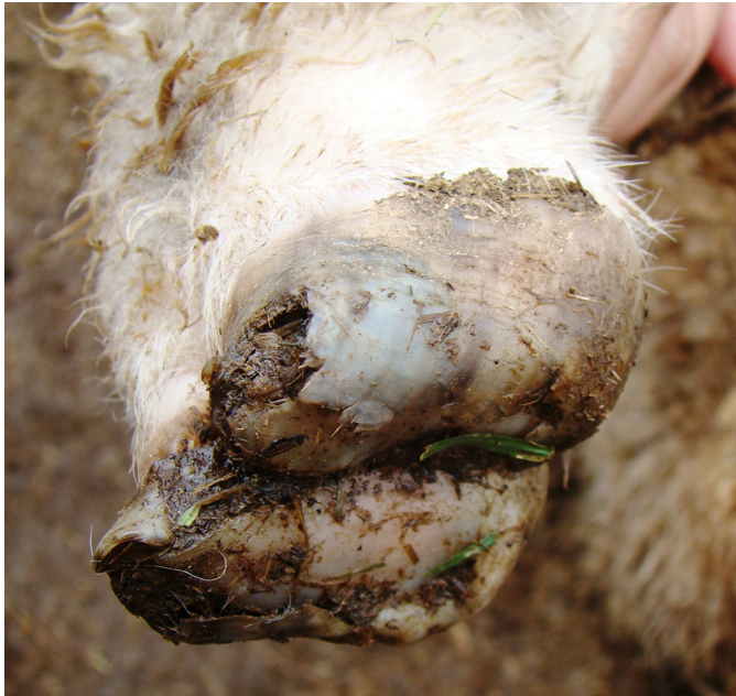
Fig.10. Dígitos de ovino com descolamento do casco tanto na região axial como abaxial sem lesão prévia da pele interdigital.

Os ovinos das propriedades avaliadas eram criados em sistema extensivo e em condições ambientais favoráveis ao desencadeamento das lesões podais (Winter 2008, Aguiar et al. 2011). Em uma das propriedades os ovinos paste-