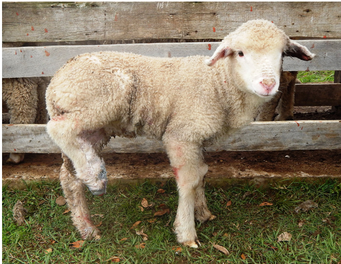
Fig.2. Ovino com membro pélvico direito flexionado e suspenso sem entrar em contato com o solo, decorrente de lesão podal acentuada.