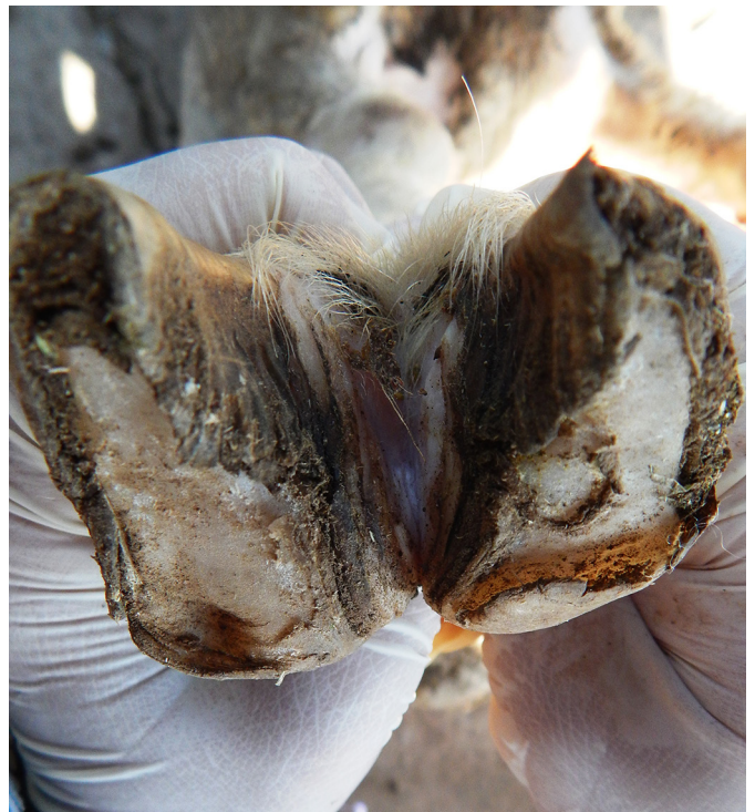
Fig.5. Região distal do membro torácico de ovino com dermatite interdigital e alopecia dessa região.

queda acentuada nos índices reprodutivos e esporadicamente apresentavam recidiva das lesões podais.